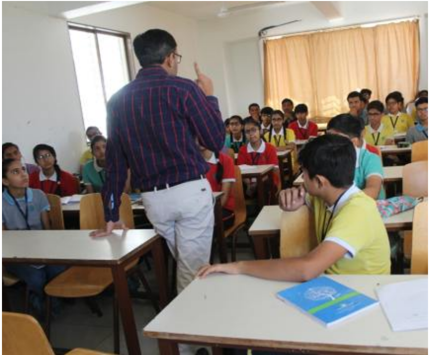
CAREER ORIENTED SESSION BY SUR DHARMESH PROFESSOR- VVPEC. RAJKOT